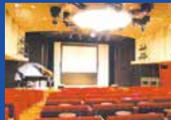
ラウンジ『ザザンクロス』 (きそ)