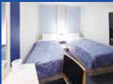
1等洋室 [インサイド] (いしかり)