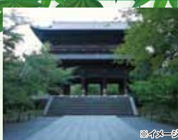
◆南禅寺 (拝観一部有料あり)