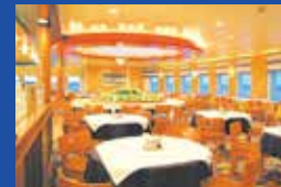
レストラン『タヒチ』 (きそ)

※いしかり、きそは全客室において禁煙となっております。喫煙は所定の場所においてお願い致します。