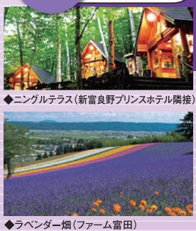
◆ニングルテラス(新富良野プリンスホテル隣接)