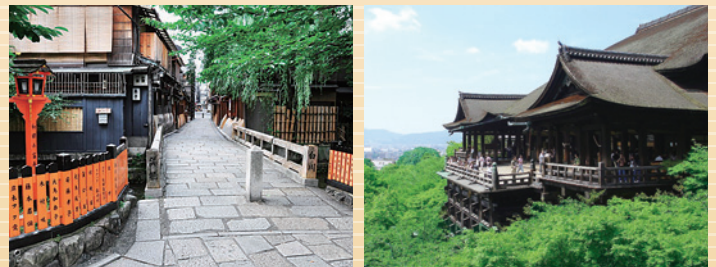
◆祇園(白川に架かる異橋)