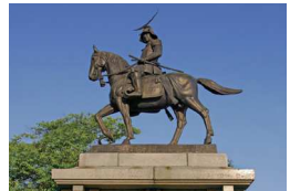
伊達政宗騎馬像

等級変更をご希望のお客様は予約時にお申込みください。(事前予約の場合の差額です。満席時は変更できない場合がございます。)