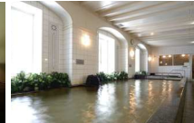
スカイスパ「サラ・テレナ」