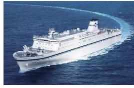
1/25 就航 新「きたかみ」