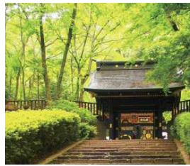
瑞巖寺の鮮やかな緑