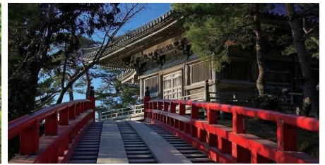
五大堂 透かし橋