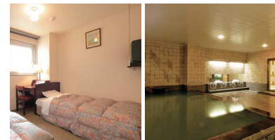
スタンダードツイン/イメージ 大浴場「三蔵温泉」/イメージ

【最寄駅】 地下鉄伏見駅 徒歩5分 JR名古屋駅 徒歩15分 【住所】 名古屋市中区栄1-8-33 【TEL】 052-211-6633